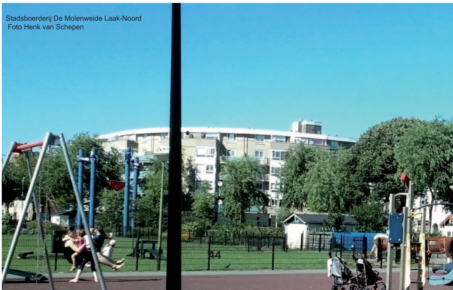
Stadsboerderij De Molenweide Laak-Noord

Groep de Mos is een partij met oog voor de vele expats in onze stad. Voor deze groep willen we de volgende verbeteringen doorvoeren: aanpak verkeersknelpunt bij de International School